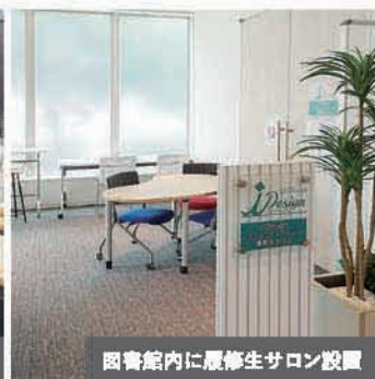
図書館内に履修生サロン設置