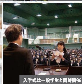
入学式は一般学生と同時開催