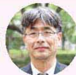
中尾 泰士 教授