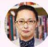
神原 ゆうこ 教授