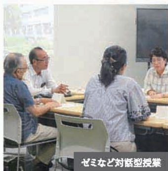
ゼミなど対話型授業