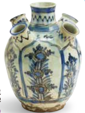
藍彩花文子持花瓶 サファヴィー朝時代 16世紀