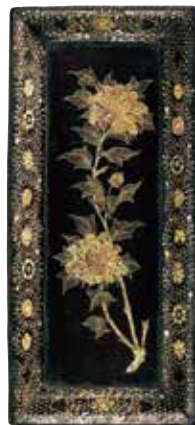
牡丹螺鈿長方盆 元~明時代 14世紀~15世紀