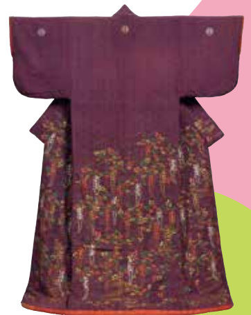
松に藤文様小袖 江戸時代 19世紀