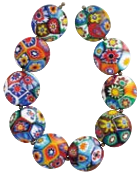
ムッリーネ連玉 20世紀