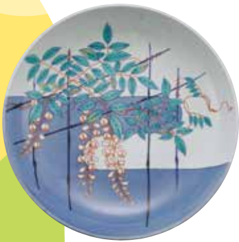
〈重要文化財〉色絵藤欄文大皿 江戸時代 17世紀~18世紀

花にちなんだきゅーぱくの名品が勢揃いします。本展の作品はすべて、「お花をさがそう!2025」の撮影キャンペーンの対象作品です。美しい花々に囲まれて、心温まる時間をお過ごしください!