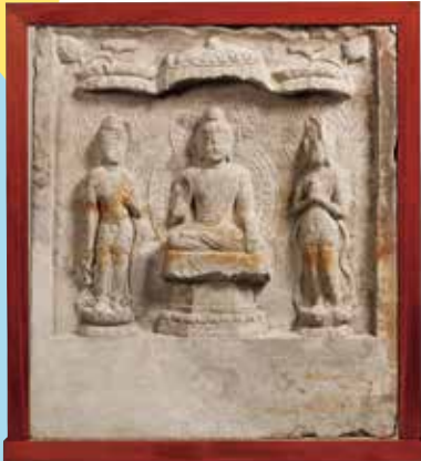
〈重要文化財〉中国・唐時代の仏像レリーフ 唐時代 8世紀