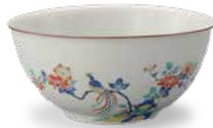
色絵花鳥三果文大鉢 江戸時代 17世紀後半