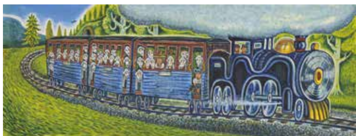
『エンソくんぎしゃにのる』(福音館書店)

本展ではもはや古典絵本の『エンソくんぎしゃにのる』(福音館書店)、平和について考える『ドームがたり』『ポチャッ ポチョッ イソップ』(共にアーサー・ピナード作、玉川大学出版部)、あの世とこの世をつなぎメキシコ死者の日のような体験満載の『天のすべりだい』(BL出版)などの原画や、白黒写真師・本橋成一撮影写真をメッタ切りしてコラージュした「NO NUKES」シリーズ、ジバング島のあちこちやストリートなどで描いた巨大キャンバス画を展示します。皆さんを誘惑し、喜びのるつぼに投げ込んでしまおう! ウェルカム!