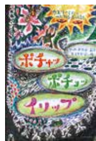
『ポチャッ ポチョッ イソップ』(玉川大学出版部)