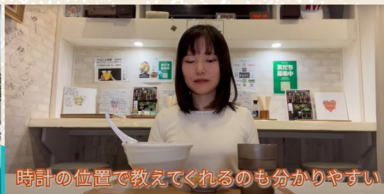
時計の位置で教えてくれるのも分かりやすい