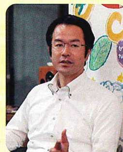
医療法人静光園 白川病院 医療連携室長