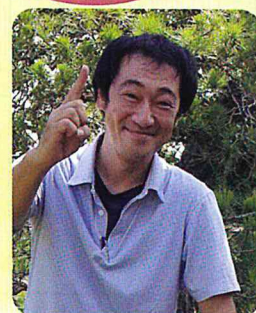
小規模多機能型居宅介護つお 管理者