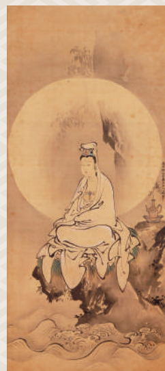
狩野探幽筆《観音四皓七賢図》のうち観音図 福岡市美術館所蔵

本展では、この仲由、守義、守房について、作品と尾形家伝来の「尾形家絵画資料」(福岡県指定有形文化財)に残る画稿を合わせて30件ほど展示し、その絵画学習と制作の様相を見ていきます。筑前の地に華開いた、尾形家三代の絵画の世界をお楽しみください。