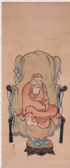
小方守房筆《遠磨図》 興徳寺所蔵

表使用図版:小方仲由筆《雑画巻》福岡県立美術館所蔵 小方守房筆《百鬼夜行図巻》福岡市博物館所蔵