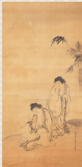
小方守房筆《寒山拾得図》 享保9年(1724)崇福寺所蔵