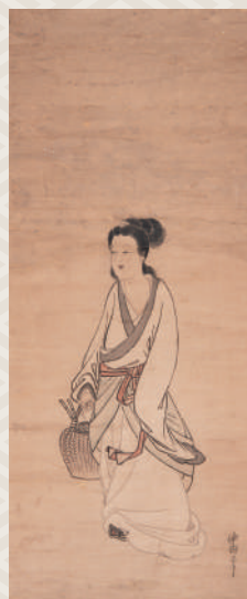
小方仲由筆《靈昭女図》 福岡県立美術館所蔵