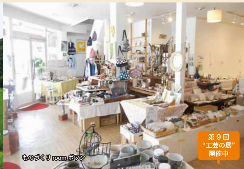
ものづくりroomポワン