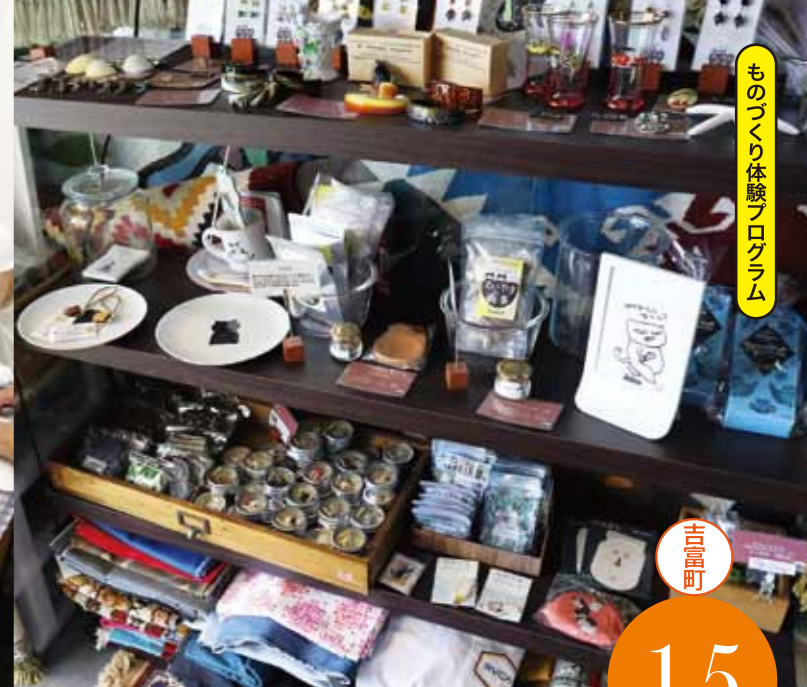
ものづくり体験プログラム