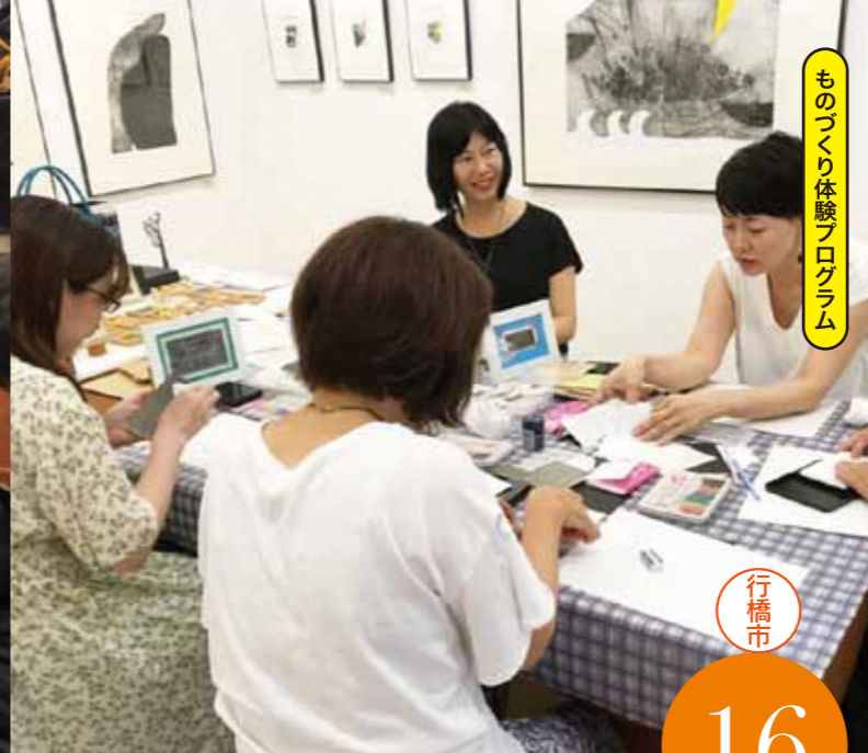
ものづくり体験プログラム