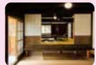
▲古民家食庵 伝法寺庄