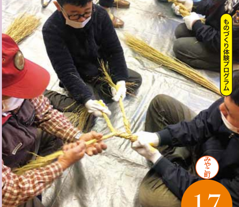
ものづくり体験プログラム

●問い合わせ先 京築連帯アメニティ都市圏推進会議事務局 (福岡県政策支援課) ☎092-643-3178 FAX 092-643-3164