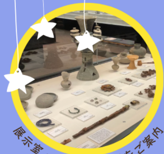
展示室・バックヤードをご案内