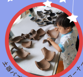
土器パズルなど子ども向けコーナー

毎年6月初め頃は当館敷地内でホタルが目撃されています。運が良ければイベント中にも逢えるかも…!?