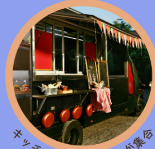
キッチンカーなど出店が集合